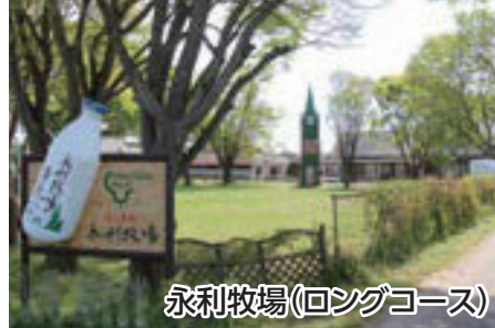
永利牧場(ロングコース)

麒麟ビール福岡工場コスモス園 約7ヘクタールの敷地に赤、ピンクなど1,000万本のコスモスが咲き乱れます。