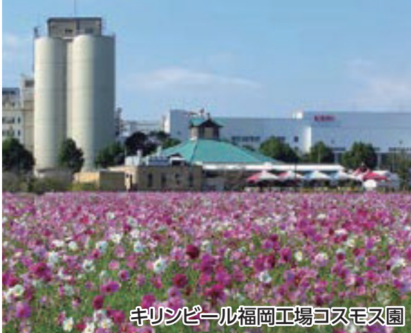
麒麟ビール福岡工場コスモス園

花立山温泉では美肌の湯をお楽しみいただき、戦跡の掩体壕、貴重な戦時資料がある大刀洗平和記念館を巡るコースです。最後は麒麟ビール福岡工場で素晴らしい景観のコスモスとビールをご堪能ください。