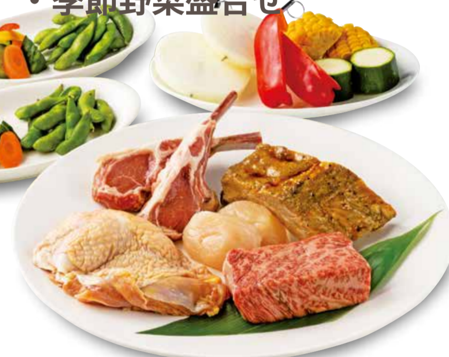
※写真は2名様分盛合せ